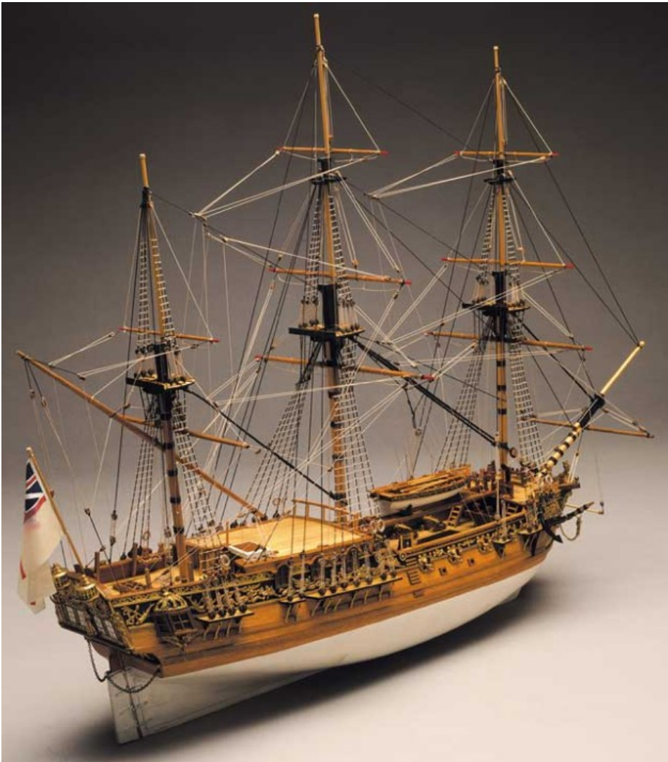
皇家卡罗琳船模型 皇家游艇卡罗琳在1749年被修造了在贝德福德造船厂作为游艇为英国的皇家家庭。